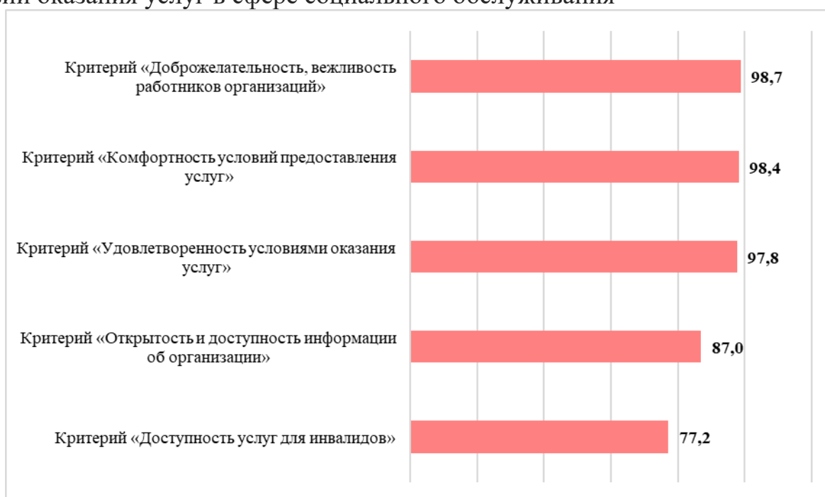
Рисунок 2.3. Средние значения по критериям оценки качества условий оказания услуг в сфере социального обслуживания

В разрезе организаций обращает на себя внимание значение лидирующего критерия «Доброжелательность, вежливость работников организаций» ОГАУСО «Специальный дом-интернат для престарелых и инвалидов в с. Репьёвка Колхозная»: в сравнении со значениями данного критерия у других организаций он ниже и составляет 90,2 балла из 100. Также выделяется значение данного критерия у ОГАУСО «Геронтологический центр «ЗАБОТА» в г. Ульяновске»: оно равно 95,2 баллам.