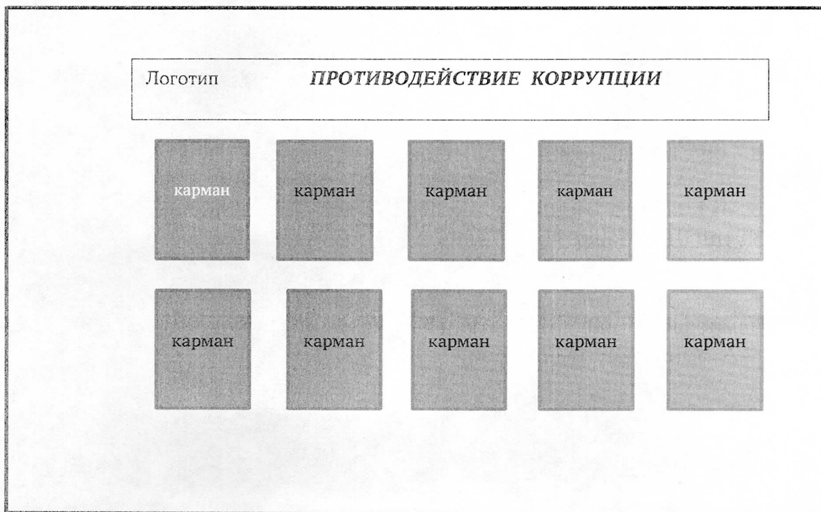
Образец информационного стенда

3.3. Рекомендуемые материалы для изготовления информационного стенда: основа – ПВХ 3мм; карманы прозрачные под лист А4 (гибкий пластик).